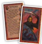
Тьма (3) Темные вожди