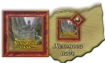
Накладки крепости Тьмы в Хельмовой Пади