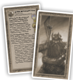
Свободные народы (5) Порабощенные государи