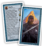
Свободные народы (5) Пробужденные государи