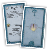
Свободные народы (10)