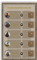
Планшет порабощения государей